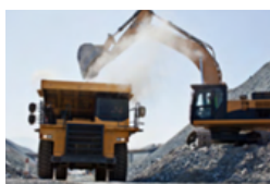
Zonas de construcción